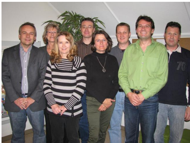
Schulrat Schulgemeinde Eschenbach - St. Gallenkappel - Goldingen